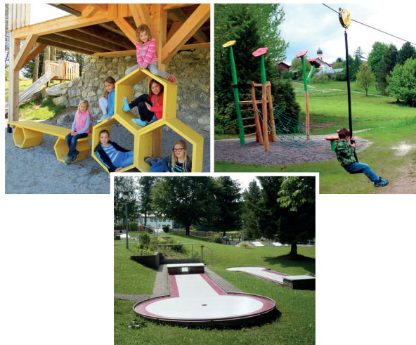
1. Auflage - 01-04-15 - gültig für 2015/16

Kleine und größere Bienenkinder können mit den beiden auf Entdeckungstour gehen. Im Dorfanger, direkt am Bienen-Erlebnispfad und an der Minigolfanlage, kann getobt und gespielt werden.