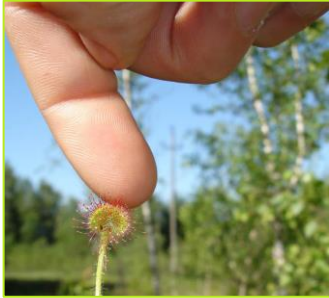
Sonnentau mit faszinierenden Haftentakeln